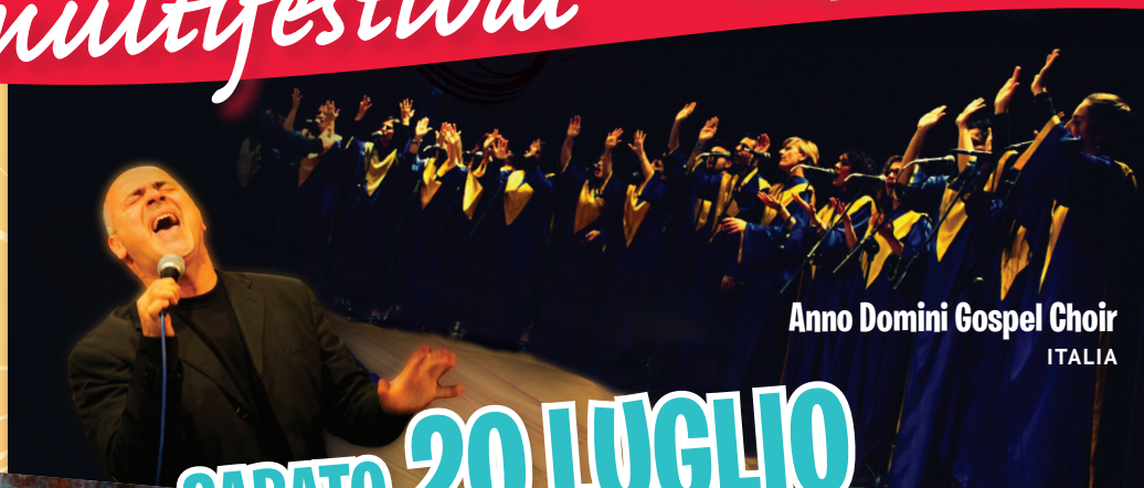
Anno Domini Gospel Choir ITALIA