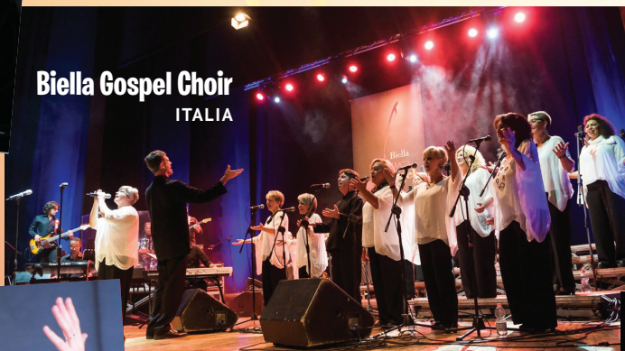
Biella Gospel Choir ITALIA